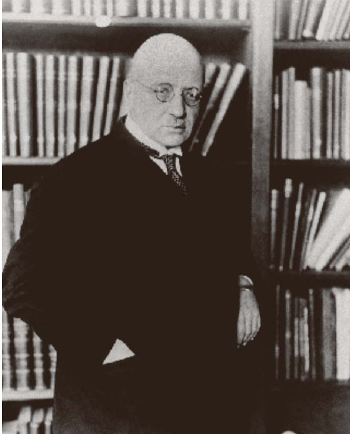
Den tyske kemisten Fritz Haber.