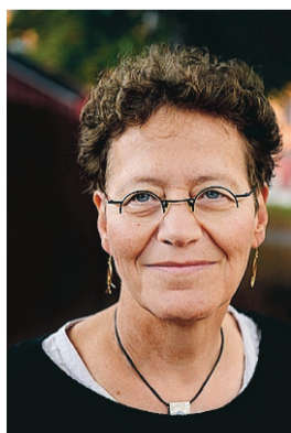
Lena Einhorn tilldelades Delblancpriset 2019 vid en ceremoni i Trosalands kyrka den 25 maj.

Ofiltrerad Med tanke på hur länge han har varit död är det slående hur starka känslor – av både kärlek och hat – som August Strindberg än idag väcker. Författaren Sven Delblanc är en av dem som kommit närmast en förklaring av nationalskaldens förmåga att ständigt tränga sig på.