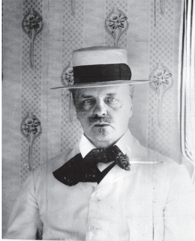
”Problemet med Strindberg är att han är framtida”, menade Sven Delblanc.

skorstenen, och hur vitklädda kvinnor och män, kanske på väg till badstaden Södertälje, stod på däck och sampråkade, medan barnen artigt stod bredvid i sina sjömanskostymer.